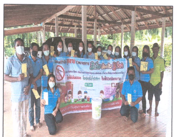
ป้ายไวนิลประชาสัมพันธ์ณรงค์ใช้เลือดออก